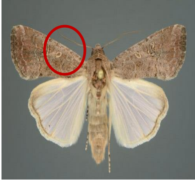
အကောင်ကြီး(အမ)