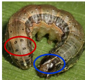
လောက်ကောင်

အရွယ်ရောက်အကောင်ကြီး အတောင်အရှည်မှာ (၃၂-၄၀)မီလီမီတာ ရှိသည်။အကောင်ကြီး (အထီး)၏ ရှေ့အတောင်၌ ကျောက်ကပ်ပုံ အစက်ပုံစံ တွင်အနက်ရောင် အနားသတ် ခပ်မှိန်မှိန်ရှိခြင်းနှင့် “ဗီ” (V)ပုံ အမှတ်အသားပါရှိခြင်း၊ အညိုဖျော့ရောင် ဘဲဥပုံ အစက်အပြောက်နှင့် သိသာထင်ရှားသည့် ကန့်လန့်ဖြတ် အစင်း တစ်ခုပါရှိခြင်း၊ ရှေ့အတောင်၏ ထိပ်ဖျားပိုင်းအနီးတွင် အနက်ရောင် အစက်အတန်းပါရှိ ခြင်းတို့ဖြစ်သည်။ အကောင်ကြီး) အမ( ၏ အတောင်မှာ ထင်ရှားသော အမှတ်အသားနည်း ပြီး ညီညာသော မီးခိုးညိုရောင် အပေါ်သေးငယ်သော ပြောက်ကျားအစက်များရှိသည်။ အထီး အမတို့၏နောက်အတောင်မှာ ငွေမျှင်အဖြူရောင်ရှိပြီး ခပ်မှိန်မှိန်အရောင်အနား သတ်ရှိသည်။